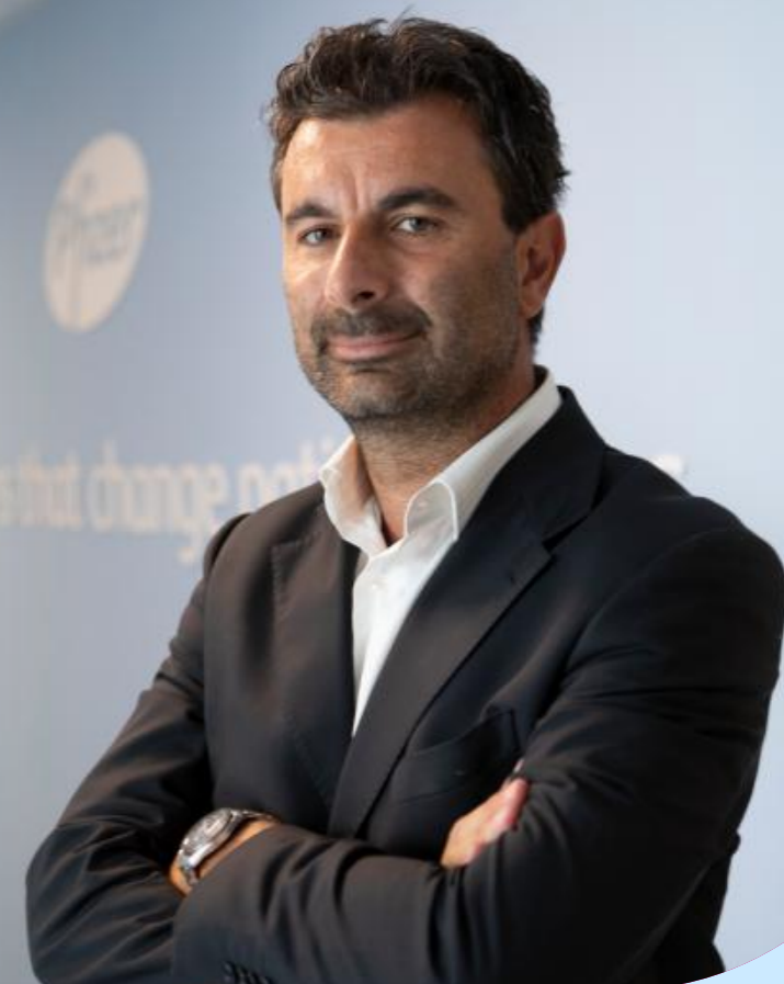
辉瑞CentreOne 阿斯利科口服固体制剂